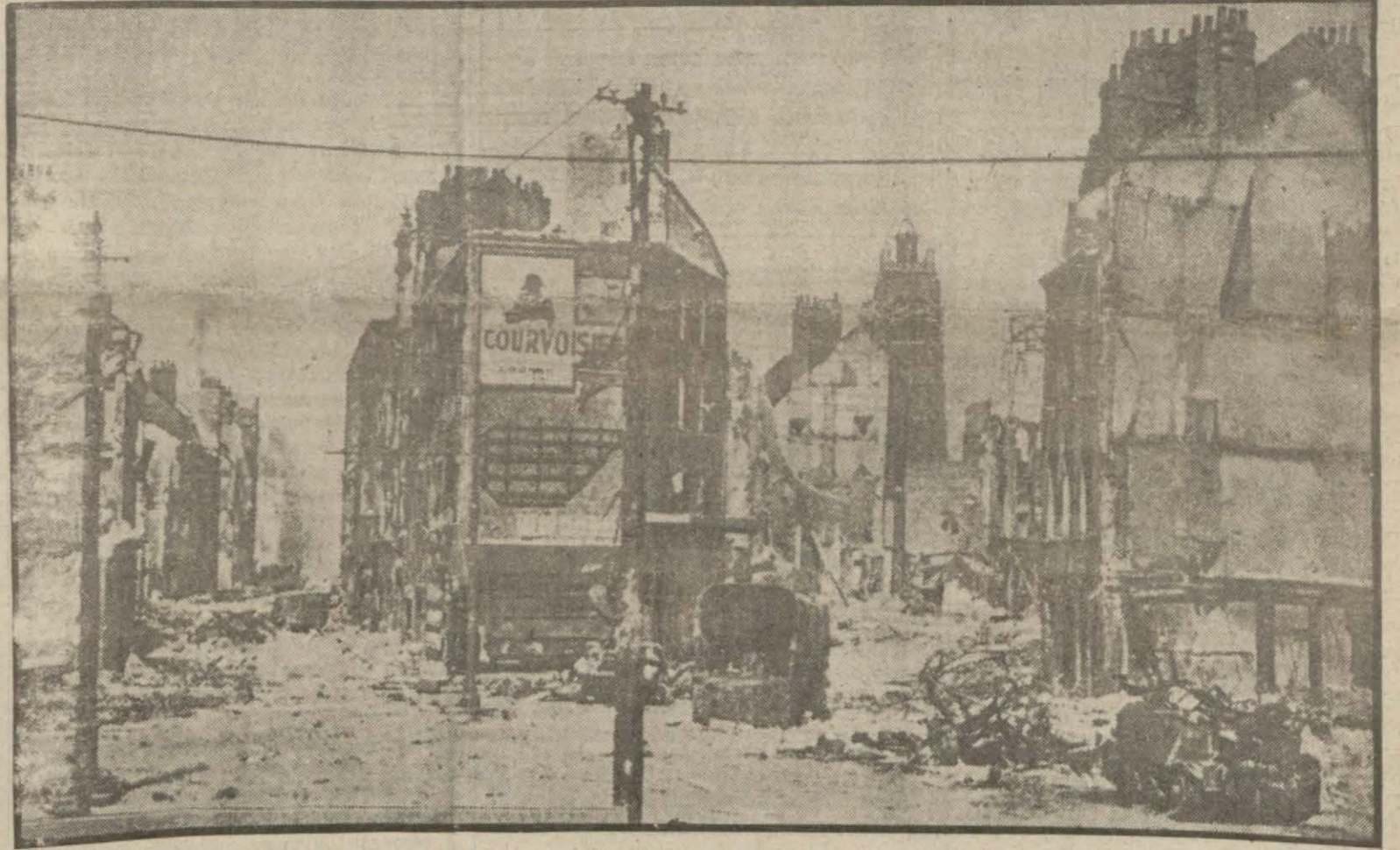
Flandr muharebelerinin sonu: Harb ateşi Dünkerk şehrini böyle yaktı

Berlin resmî mahfellerinden alınan malûmata nazaran Alman - Fransız murahhasları arasında cereyan edecek olan müzakerelerde İtalya resmen temsil edilmeyecektir. (Devamı 7 inci sayfa)